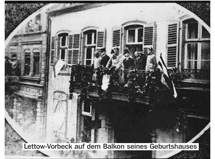
Lettow-Vorbeck auf dem Balkon seines Geburtshauses

bauer, Horst Janson) die im Januar und Februar 2007 im ZDF gezeigt wurden. Beide Filme pflegen das koloniale Klischee und das Bild von unmündigen Afrikanern und Afrikanerinnen, die dementsprechend auch nur, neben der schönen Landschaft und den wilden Tieren, die Kulisse bilden dürfen und als Statisten mitspielen. Die Helden sind weiße Männer und Frauen. Ganz wie in den „guten alten Zeiten“ des „ritterlichen, unbesiegt“ Helden, General Paul von Lettow-Vorbeck. Hierzu passt auch, dass das kolonialverherrlichende Lied „Wie oft sind wir geschritten auf schmalem Negerpfad“ bis heute in dem bekannten und weit verbreiteten Liederbuch „Der Bettelmusikant“ abgedruckt wird. (9) Aus unserer Sicht gibt es nichts am Kolonialismus und „nichts an der Person Lettow-Vorbecks, das heute noch verehrungswürdig wäre“ (10) oder gar Vorbildfunktion hätte.